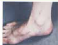
足の血管にそって注射を打ちミミズばれになる