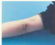
腕の静脈に注射したあと