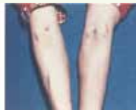
ミミズばれになった注射のあと