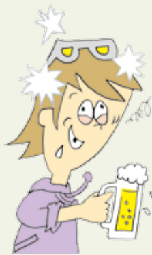
フラッシュバック