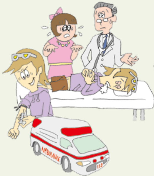
きゅうせいちゅうどく 急性中毒死