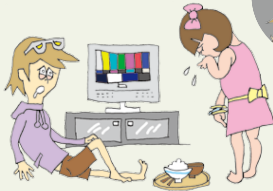
しゃかいてき ふ てきおう 社会的不適応