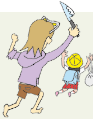
はんしゃかいてきこうどう 反社会的行動