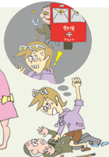
じんかくしょうがい 人格障害

やくぶつ しょう 薬物の使用を あとも ちようき のこ しょうじょう やめた後も、長期に残る症状も たくさんあるんじや。