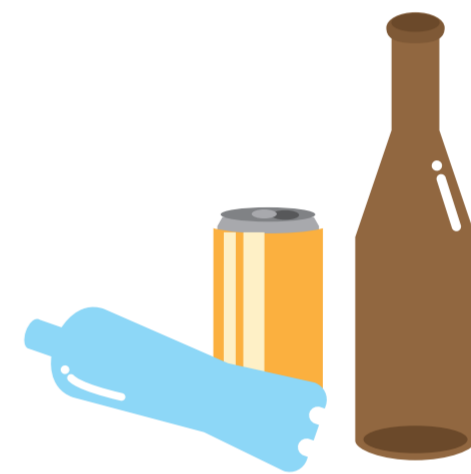
屋外に放置された空きビン・缶・ペットボトル