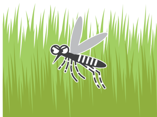
風通しの悪い やぶ・草むら

公園、学校、寺社、空海港、駅などの施設を管理されている方もご協力をお願いします!